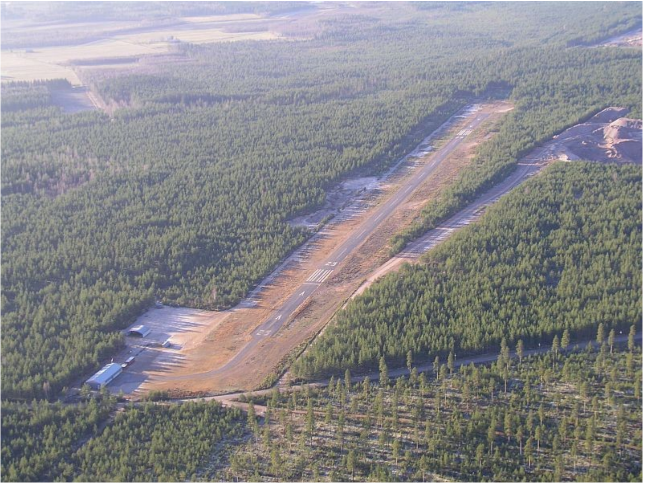
Kuva 2. Kiitotie ilmasta.